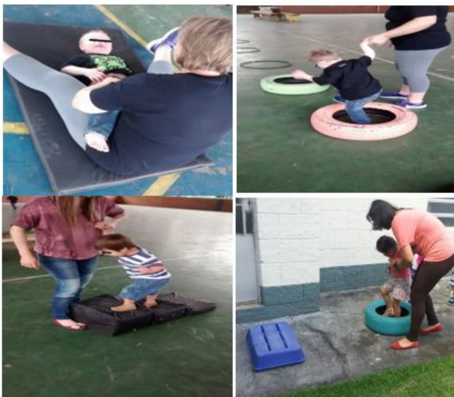
Figura 1. Atividades motoras

Por fim, eram desenvolvidas atividades lúdicas para estimular as diferentes áreas do desenvolvimento psicomotor, partindo do conceito que através da brincadeira a criança interage e percebe o mundo real, despertando assim a curiosidade para aprender algo novo através de jogos e objetos lúdicos. (Ravelli; Motta, 2005). As atividades propostas não estimulavam apenas áreas motoras específicas do desenvolvimento psicomotor, mas estimulavam de forma associada diferentes áreas que compõem o movimento humano, como se observa nos registros abaixo.